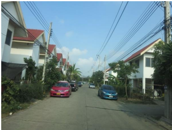
国営住宅公社の低コスト住宅

第1世代はインフォーマルな居住形態を含めて多様なかたちでアフォーダブルな住宅を求めたが、その子世代はフォーマルな住宅市場にアクセスし、主に持家(40.5%)と賃貸住宅(32.6%)の2形態に収れんしている。第1世代の78.2%は既に60歳以上であり、急速な高齢化が進んでいる。第一世代の多くは子と同居(67.8%)あるいは経済的支援を受けて、安定的な生活を送っている。老後の暮らしを大変心配している第1世代は13.4%と少ない。