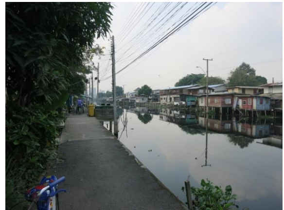
運河沿いのスクワッター地区の居住改善

Low cost houses of government managed public corporations