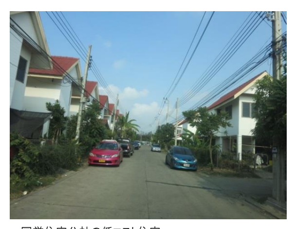
国営住宅公社の低コスト住宅 Low cost houses of government managed public corporations

第1世代はインフォーマルな居住形態を含めて多様なかたち でアフォーダブルな住宅を求めたが、その子世代はフォーマ ルな住宅市場にアクセスし、主に持家(40.5%)と賃貸住宅 (32.6%)の2形態に収れんしている。第1世代の78.2%は既に 60歳以上であり、急速な高齢化が進んでいる。第一世代の 多くは子と同居(67.8%)あるいは経済的支援を受けて、安定 的な生活を送っている。老後の暮らしを大変心配している第 1世代は13.4%と少ない。