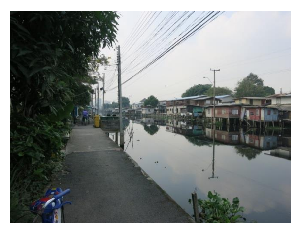
運河沿いのスクォッター地区の居住改善 Improvement of residences in squatter area along canal